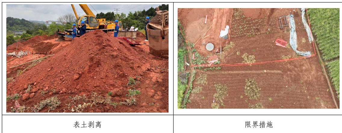
图 3-1 本项目水保措施照片