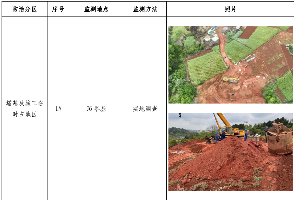
表 1.2-2 本季度水土保持监测点统计表