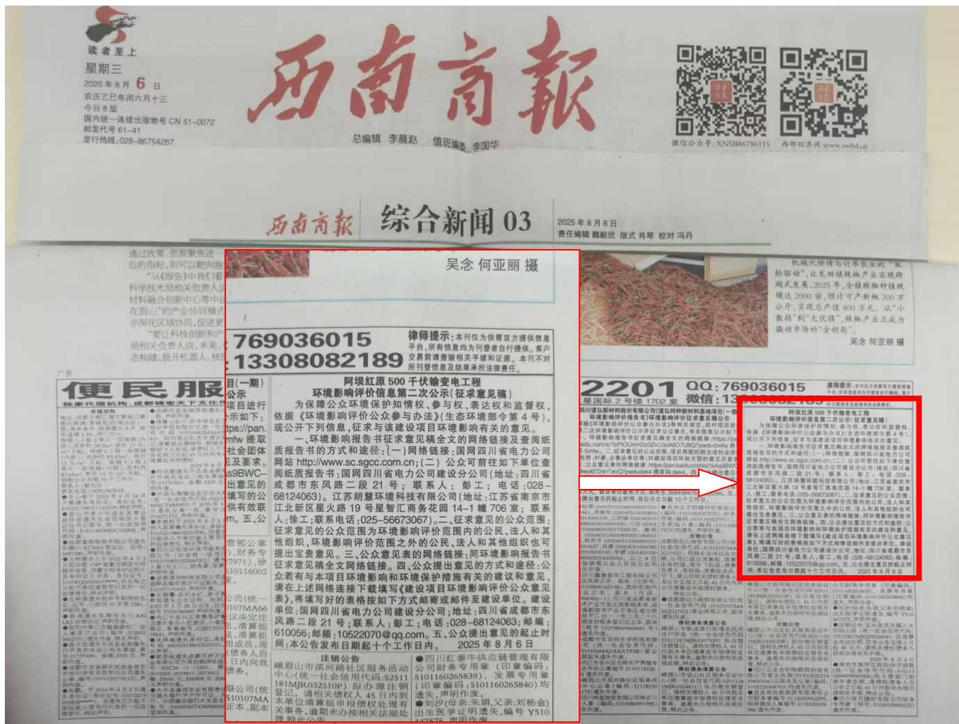
图 4.2 报纸公示（报纸 8 月 6 日版）