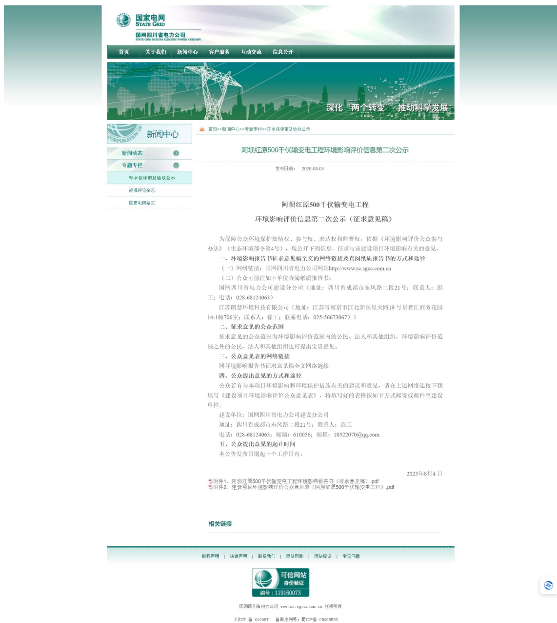
图 4.1 征求意见稿公示