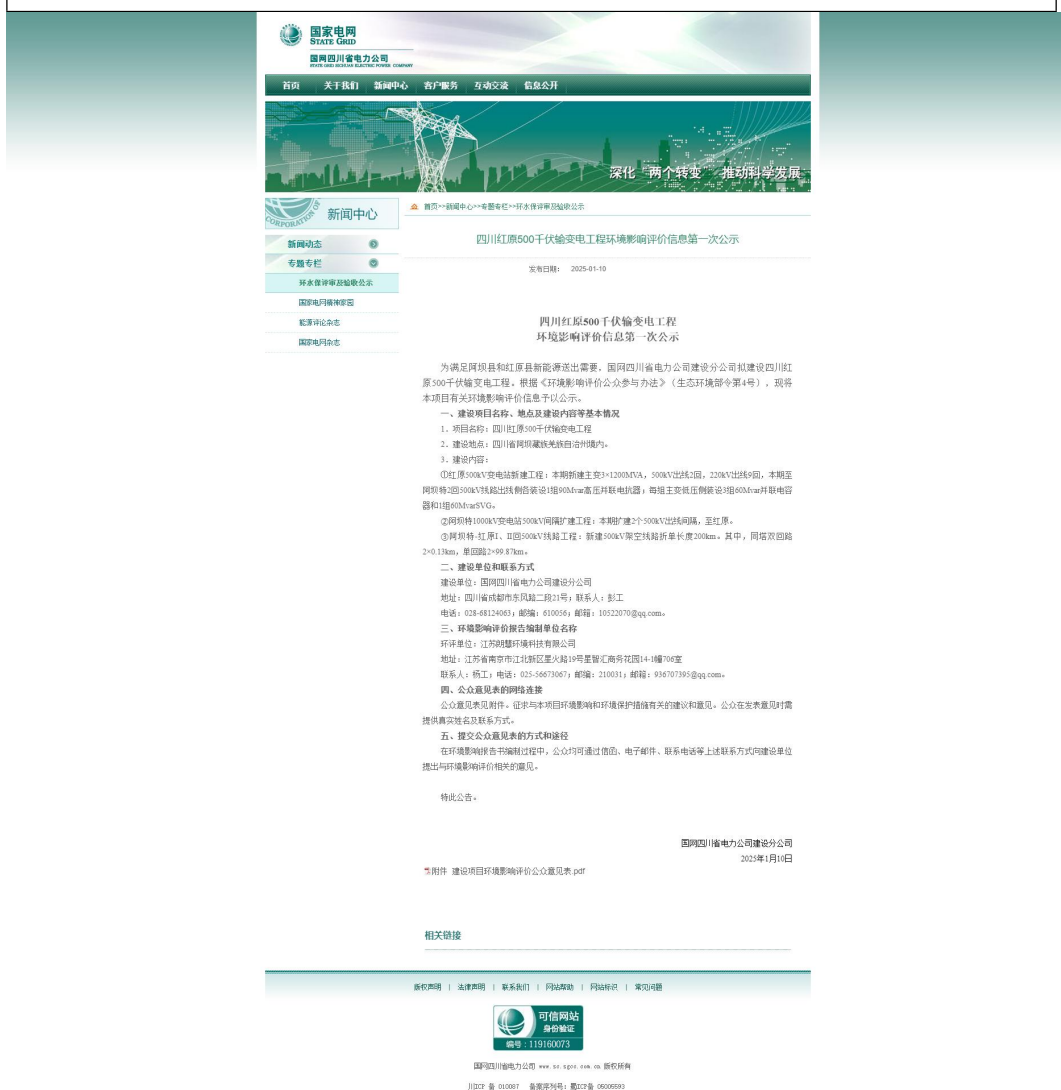
图 3.1 首次信息公示