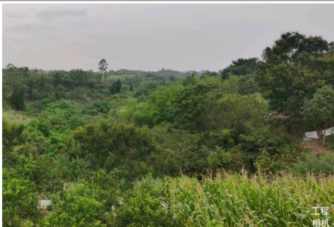
黄家坝~大桥改接老鸦 35kV 线路工程沿线照片