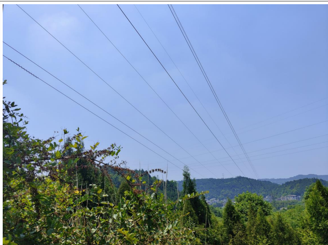
老鸦-城南 35kV 线路工程沿线照片